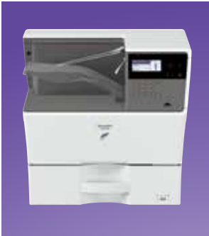
Compacta configuración de escritorio