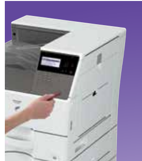
Puerto USB ubicado cómodamente

Seleccione una impresora de alto rendimiento para conseguir la productividad que necesita