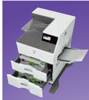
Capacidad de papel ampliable